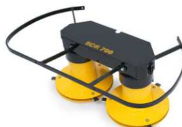
17 990 Kč