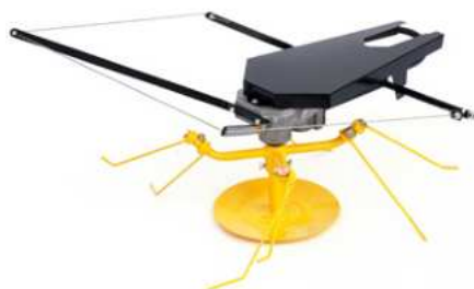
14 990 Kč