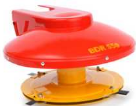
10 990 Kč