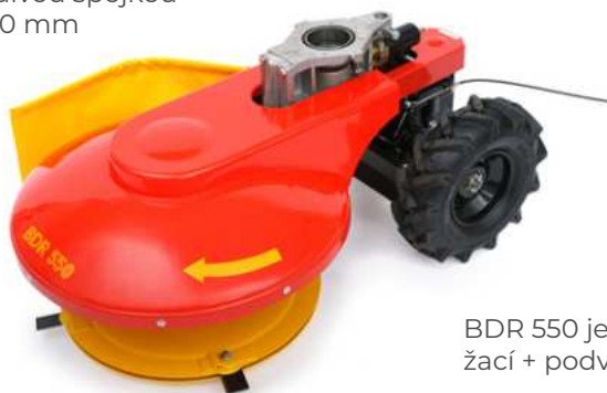
BDR 550 jednobubnové žací + podvozek

Pro pohonné jednotky s odstředivou spojkou Ø 80 / 120 mm