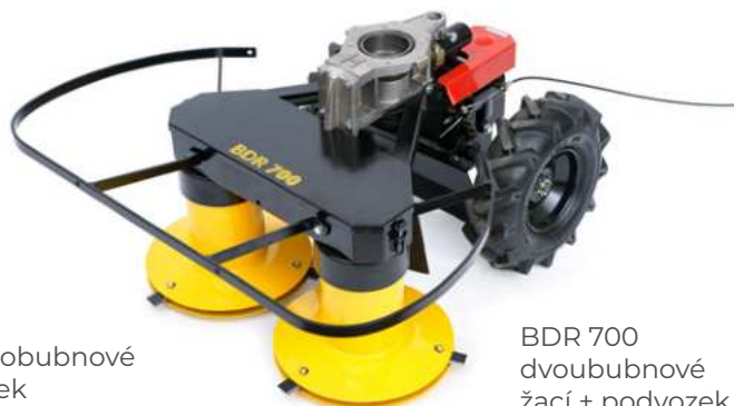
BDR 700 dvoububnové žací + podvozek