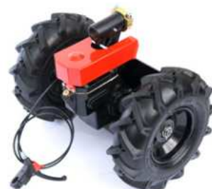
16 990 Kč